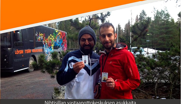
Nihtisillan vastaanottokeskuksen asukkaita