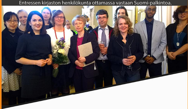
Entressen kirjaston henkilökunta ottamassa vastaan Suomi-palkintoa.