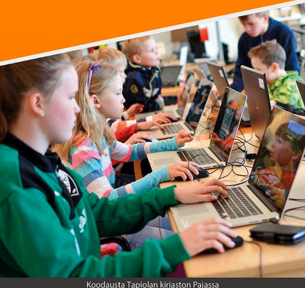
Koodausta Tapiolan kirjaston Pajassa

Lasten tapahtumat 2174 kpl, 46 316 asiakasta